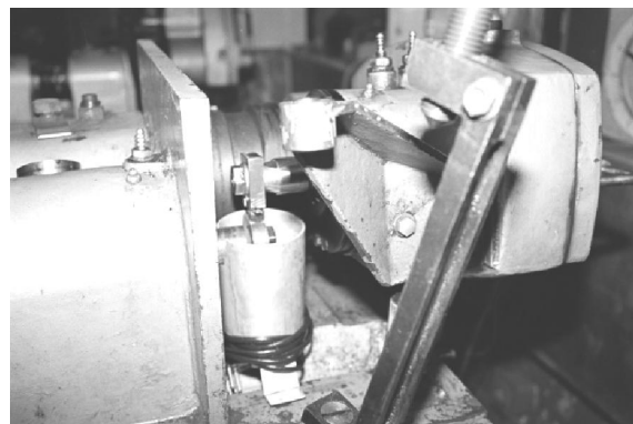
Рис. 2. Узел трения на испытательной машине трения 2070 СМТ-1

Фото узла трения на испытательной машине трения 2070 СМТ-1 приведено на рис. 2.