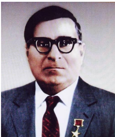
Ивченко Александр Георгиевич

Окончил Харьковский механико-машиностроительный институт по специальности двигатели внутреннего сгорания (1935). Работал на авиамоторном заводе в Запорожье. С 1946 главный конструктор, с 1963 генеральный конструктор. Под руководством Ивченко А.Г. создан ряд поршневых, турбовинтовых и турбореактивных двигателей для самолётов и вертолетов Ан, Ил, Як, Бе, Ми, Ка и др.